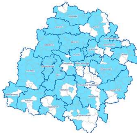
Mapa gmin deklarujących korzystanie z BAWL.

Aplikacja do prowadzenia Bazy Adresowej Województwa Łódzkiego jest dostępna tylko dla zalogowanych operatorów pod adresem: www.adresy.lodzkie.pl